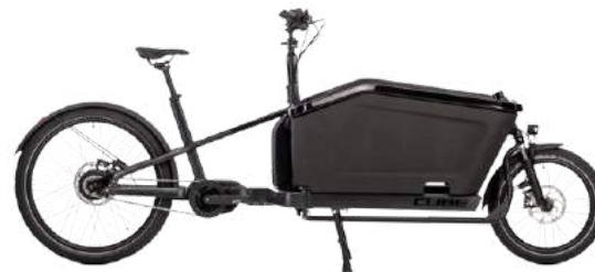
Cube Cargo Hybrid

* Modelle sind nur Beispiele und können individuell ausgesucht werden. Die E-Bikes werden alle 12-24 Monate je nach Bedarf ausgetauscht (wenn das Abo gewählt wurde).