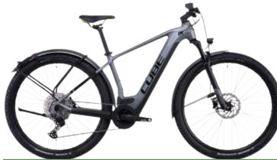
Cube Reaction Hybrid Pro 625 Allroad