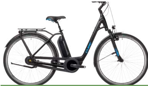
Cube Town Hybrid Pro 500