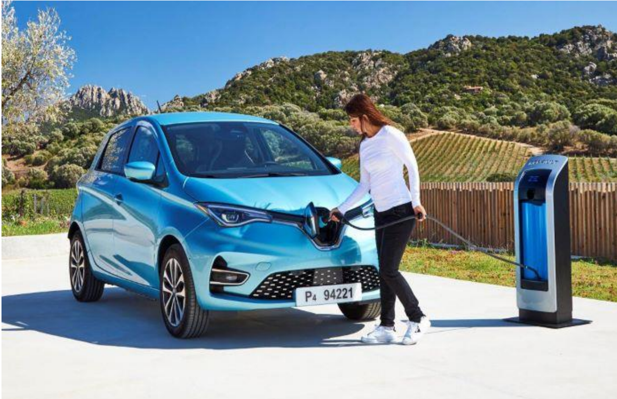
e-Car-Sharing & -Ladestation