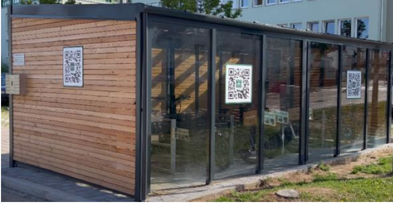
e-Bike-Verleihstation in Wolnzach